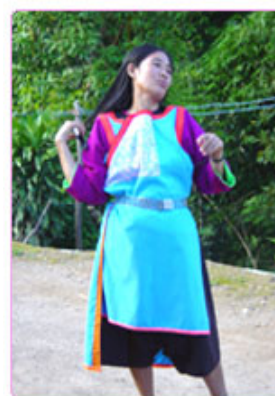
การแต่งกายของสาวลีซู