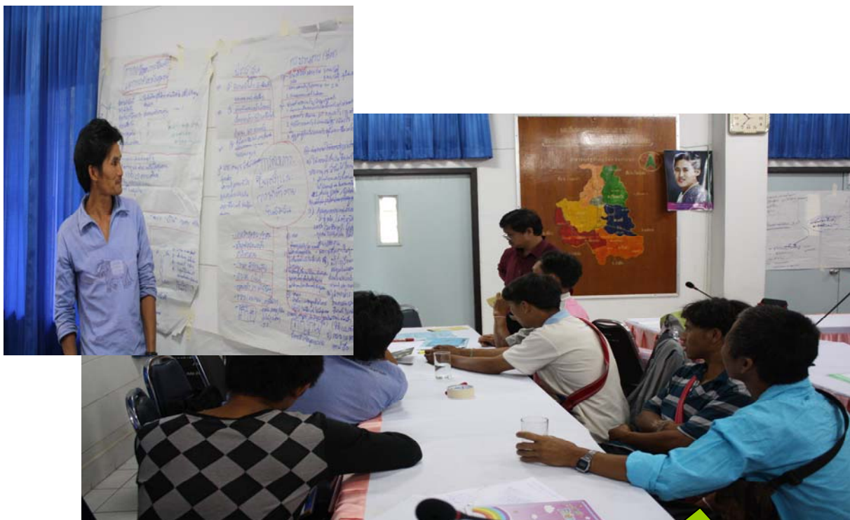
SRM กลุ่มลาหู่