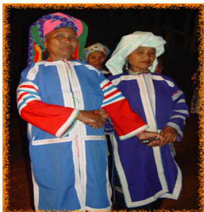
การแต่งกายของชาวลาหู่

ชาวลาหู่มีความเชื่อถือว่าถ้าใครขโมยสิ่งของผู้อื่น เมื่อตายไปแล้วจะมีชีวิตความเป็นอยู่ลำบากกับสิ่งของนั้น นอกจากนี้จะห้ามเล่นการพนัน ข้อห้ามเหล่านี้ ปัจจุบันยังใช้กันอยู่บ้าง