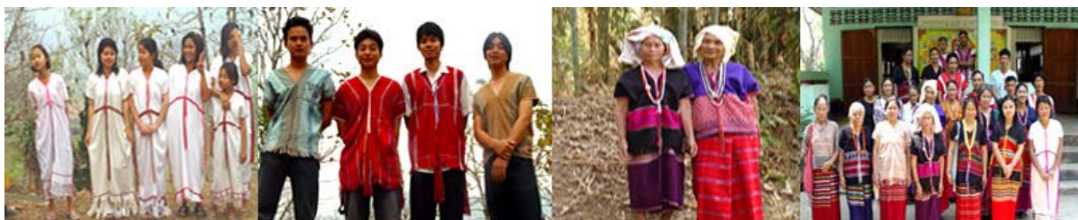
การแต่งกายของปกาเกอญอ

กะเหรี่ยงนับถือศาสนาคริสต์ ผีและพุทธรวมกัน ผีที่นับถือคือ ผีเจ้าที่ และผีต่างๆ ที่สิงสถิตอยู่ตามป่า ภูเขา ลำห้วย ไร่นา และในหมู่บ้าน ผีร้ายจะทำให้ประสบภัยพิบัติ จึงต้องมีการเอาใจผีด้วยการเซ่นสังเวยด้วยอาหาร หมู ไก่ ฯลฯ นอกจากนี้ยังเชื่อว่าคนเรามีขวัญอยู่ในร่างกายอยู่ทั้งหมด 33 ขวัญ ขวัญจะทิ้งหรือหายไปก็ต่อเมื่อคนๆ นั้นตาย ขวัญชอบหนีไปเที่ยว และอาจถูกผีร้ายทำร้ายหรือกักขังไว้ ซึ่งจะทำให้คนผู้นั้นป่วย การรักษาจึงต้องมีการเรียกขวัญให้กลับมา พร้อมกับทำพิธีผูกข้อมือรับขวัญ